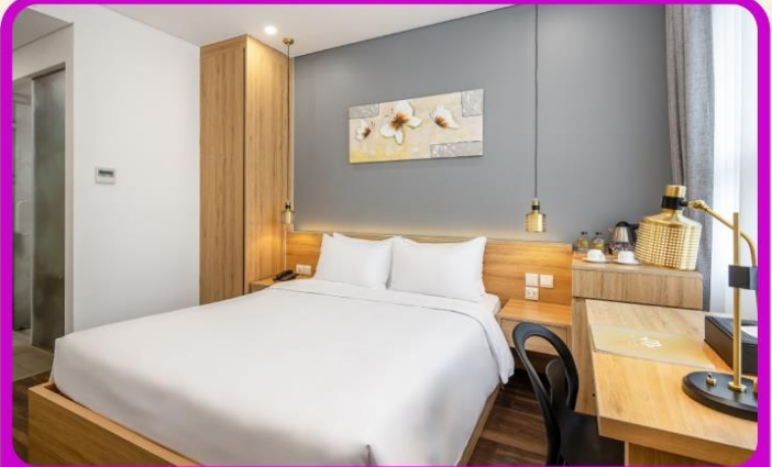
พักเมืองดานัง 4 ดาว 2 คืน