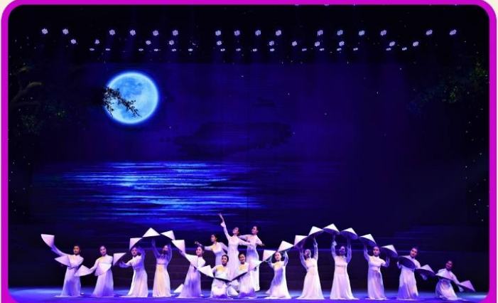
ชมการแสดง Charming Show Danang