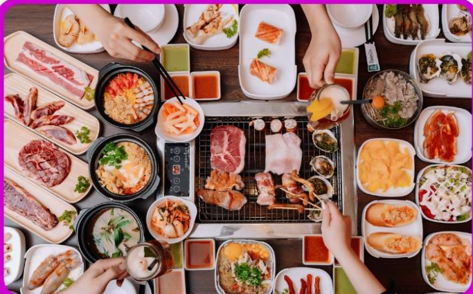
พิเศษ!! เมบูซาซิมิ+บุฟเฟ่ต์ปิ้งย่าง